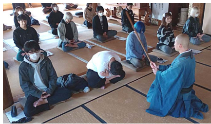
遠足(令和5年度) 能成寺 坐禅体験