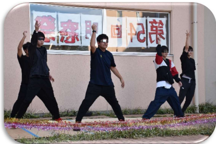
ダンスパフォーマンス