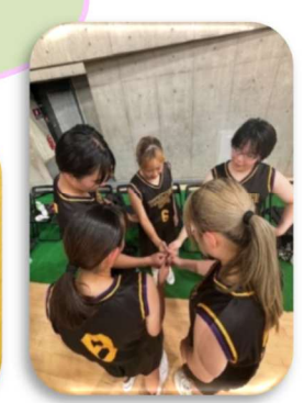
女子バスケット ボール部