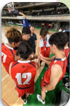
男子バスケット ボール部