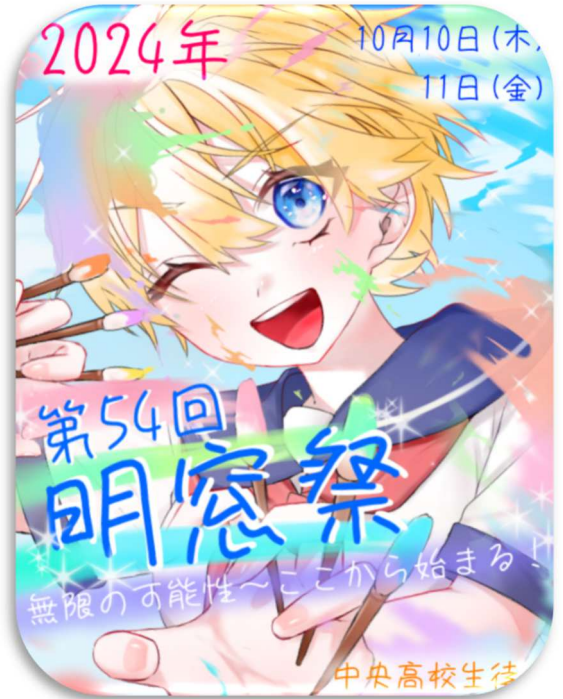
【今年度のポスター】

10月10日(木)・11日(金)、中央高校定時制の学園祭「明窓祭」が行われました。1日目は体育祭、2日目は校内オリエンテーリング、部・同好会発表、有志イベント(パフォーマンス・模擬店、校内装飾など)を行い、大いに盛り上がりました。また、昨年までの「ヨゲンノトリ消毒スプレー」の作製にかわり、今年は全校で「シェアプロジェクト・Plantit」の作製に取り組みました。種の入った台紙に、温かく幸せな気持ちを込めたメッセージをそれぞれ書き込んで作製しました。これは、山梨県内の公的機関に配布する予定です。