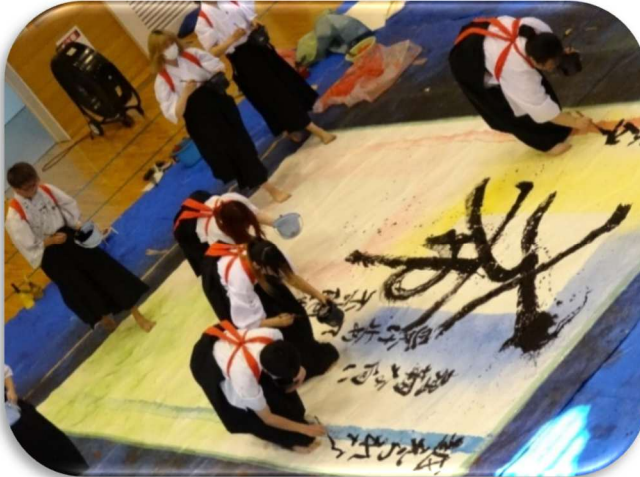
書道同好会パフォーマンス