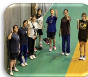
女子バドミントン部