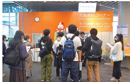
遠足（令和6年度） 山梨中銀金融資料館 山梨県立図書館見学